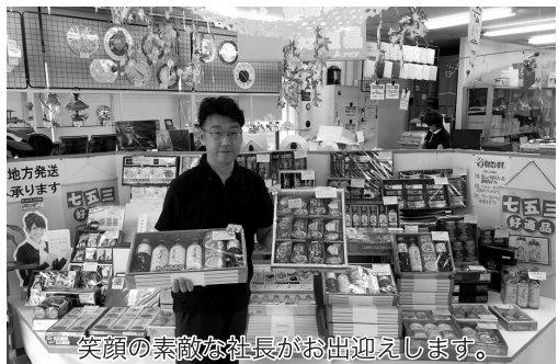
笑顔の素敵な社長がお出迎えます。

その他にも会社やお店の役に立つタオルやティッシュ、ボールペンなどの名入れもしてくれま。長寿や卒業の記念品など大切な記念日を祝う名入れ商品もできるそうなので、ぜひオリジナルデザインの記念品をつくってみてはいかがでしょうか。これからお歳暮やクリスマスなど、なにかと贈り物をする機会が多い季節になってきます。お世話になった方々への贈り物をぜひ「ギフトショップ タニノイ」でお求めになられてみてはいかがでしょうか。