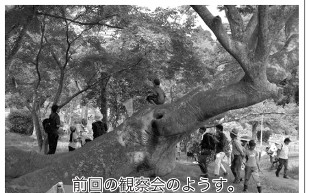
前回の観察会のようす。