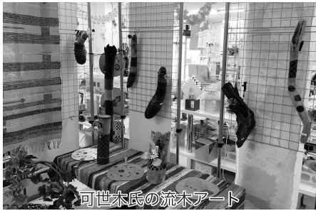
可世木氏の流木アート