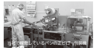
当社で稼働しているパンの正ピロー包装機

機械を導入することにより、（導入前）1人あたり1時間に180個生産（導入後）1人あたり1時間に1,000個生産 生産性向上と収益率増加の事業計画を作成し採択されました。