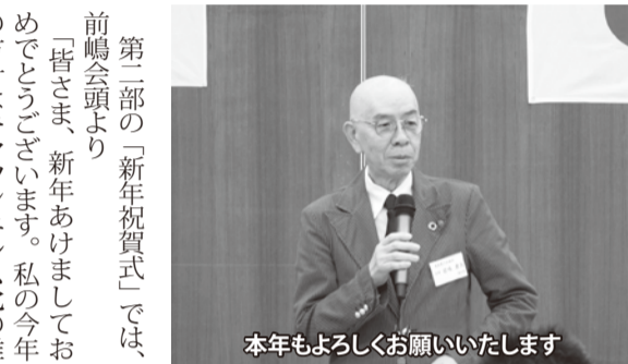
本年もよろしくお願ひいたします

第二部の「新年祝賀式」では、前嶋会頭より「皆さま、新年あけましておめでとうございます。私の今年の方針はキャッシュレス化の推進です。キャッシュレスは黒船であると常々言っています。これをやらないとお店や会社はたいへんな事になると思います。一日も早い導入を皆さまにお願いしたいところです。現在、観光に力を入れお客さんをお呼び込もうとしています。若い世代の場合、スマートフォンひとつで来なければ買物も出来ないでしょうし、そんな観光地にも足を運ばない。電子マネーやクレジットカード決済等への対応は不可欠です。『市内のお店で買いたいものがあつたがそのお店は現金しか扱っていません。何かかならないでしょうか。』私は最近、とある学生にこんなことを言われました。私は『大丈夫、商工会議所がやります。』と返してしまいました。今年も商工会議所に対する皆さまのご理解とご協力を何卒よろしくお願い致します。』