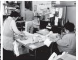
手作りだからうまい!