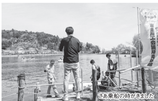
文責 令和5年度会長 小川 喜晴

今年は2日間の開催で、総勢約100組の方々が市内外から八鶴湖畔にお越しいただきボートを利用されました。本当にありがとうございました。 私たち東金商工会議所青年部は毎年八鶴湖畔の桜の植樹を行っており、令和5年度で10本目となりました。八鶴湖をさ