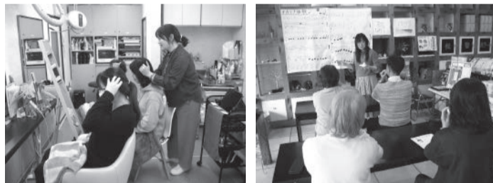
「バツと顔が明るくなるセルフヘッドマッサージ講座」 「初めてのオカリナ体験～お茶の香りに包まれて～」

今年度も第6回となる東金まちゼミの開催を予定しているため、参加を希望するお店・参加者の方は続報をお待ちください。