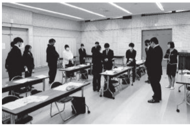
皆に注目されながら名刺交換

4月9日（木）・10日（金）の2日間、会員事業所より7社12名参加のもと新入社員セミナーを開催。 1日目は、自己紹介から行い、言葉遣いをチェックしました。その後の自己分析では一人一人の個性を把握し、仕事の向き合い方などについて丁寧なアドバイスを受けました。午後は、お辞儀の仕方などのビジネスマナーの実践指導を受け1日目は終了。 2日目は、受講生同士で電話対応の受け答えや名刺交換など、より実践的なビジネスマナーの習得を行いました。最後に