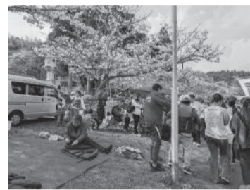
乗船の行列ができました

3月27日（金）から東金桜まつりが開催され、その中で3月28日（土）・29日（日）・30日（月）・4月4日（土）の4日間、東金市観光協会の協力のもと、八鶴湖畔にて「レンタルボート」事業を実施いたしました。 本事業は、八鶴湖でボートに乗ることが出来る貴重な機会です。本年は桜の開花状況にも恵まれ、多くの来場者に湖上からの桜を楽しんでいただくことが出来ました。ボートを初めて体験される方も多く、はじめは漕ぎ方に戸惑う姿も見られましたが、湖上に出ることで